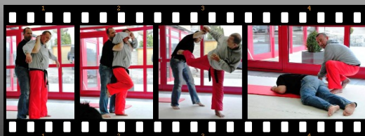
Mit Geist und Seele eins...Power ohne Wut!

Unser höchstes Ziel ist es Selbstvertrauen und dadurch das nötige Selbstbewusstsein zu schaffen. Dieser spezielle Personenkreis wird durch Rollenspiele in typische Konfliktsituationen versetzt. Teilnehmer können dadurch situatives Handeln erüben, Selbstsicherheit gewinnen, Situationen mit Worten verstärken, Ängste verlieren und Zivil-Courage aufbauen.